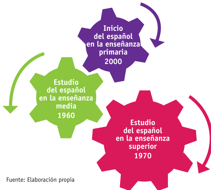
Esquema 2. Estudio del español en Gabón

Hasta ahora, cada bloque de enseñanza parece seguir su trayectoria, como veremos a continuación en las diferentes descripciones.