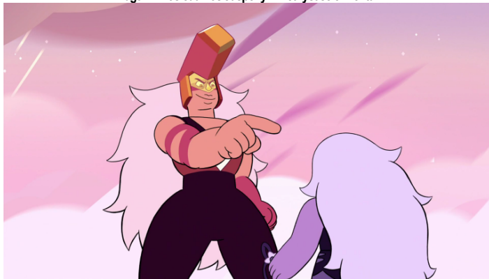
Imagen 7. Los cuarzos Jasper y Amethyst se enfrentan.