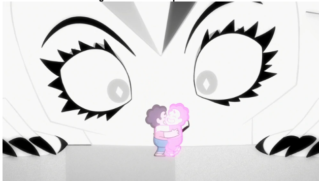
Imagen 9. Abrazo de aceptación de Steven.

Fuente: Steven Universe, capítulos 531-532 Change your mind .