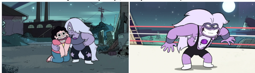
Imagen 6. 6.1 Steven y Amethyst; 6.2 Amethyst convertida en Purple Puma.

Fuente: Steven Universe, capítulo 109 Tiger Millionaire .