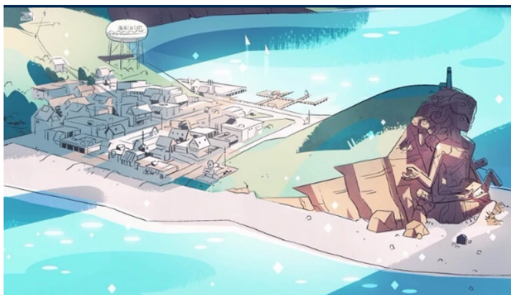
Imagen 1. Beach City.