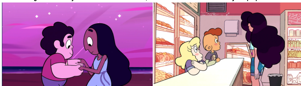
Imagen 5. 5.1 Steven y Connie bailan antes de la fusión; 5.2 Stevonnie se encuentra con Sadie y Lars por primera vez.